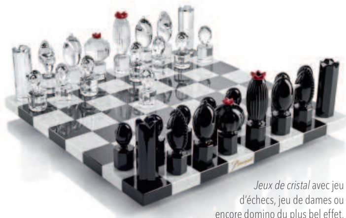
Jeux de cristal avec jeu d'échecs, jeu de dames ou encore domino du plus bel effet.

Dans l'espace tout juste rénové de la galerie-boutique, sont présentées les nouvelles collections comme les classiques qui font toujours la fierté de la Maison et l'engouement des clients à travers le monde.