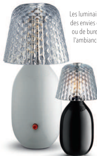
Les luminaires donnent des envies de boudoirs ou de bureaux à l'ambiance tamisée.