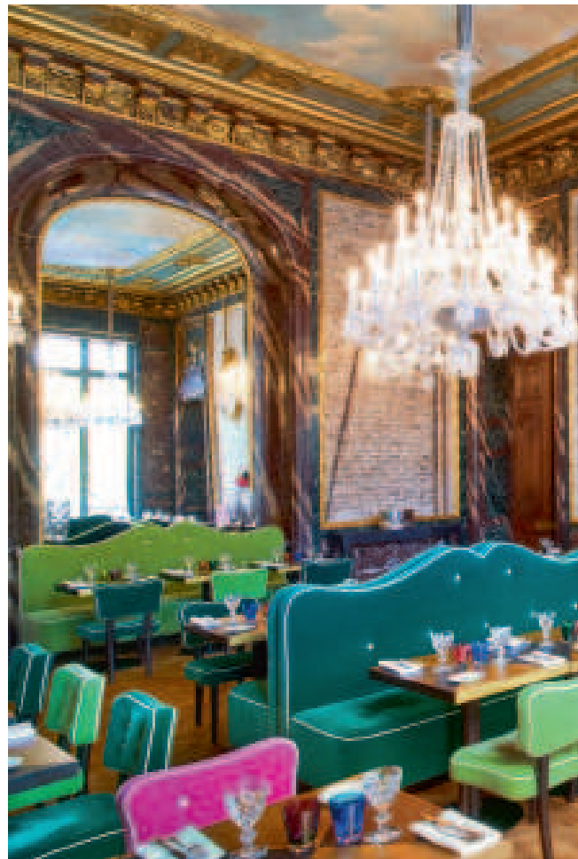
Au premier étage, autour du lustre de 157 lumières qui accueille en haut de l'escalier, le bar reçoit à partir de 17 h. Pour des cocktails signature toujours allusifs aux grands noms qui ont marqué l'histoire de Baccarat.

Dans l'espace tout juste rénové de la galerie-boutique, sont présentées les nouvelles collections comme les classiques qui font toujours la fierté de la Maison et l'engouement des clients à travers le monde.